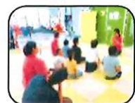
お話をよく聞いて…