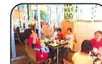
お食事体験や調理活動も ↑楽しみのひとつ♪↓