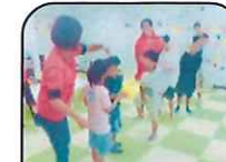
↑みんなで力を合わせて↓