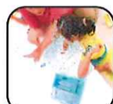
宿題も頑張って取り組みます