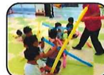
♪バルーンアート体験♪