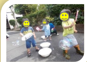
しゃぼんだまあそび