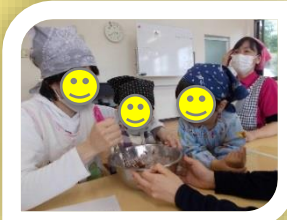
おやこクッキング

住所：鹿屋市笠之原町5-58-2 TEL：0994-45-5711 mail：children-akari@kanoya-choujuen.jp 営業時間：月～土曜日 8：30～17：30