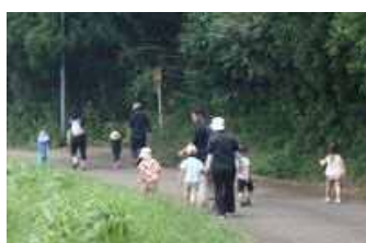
さんぽ (自然・運動)