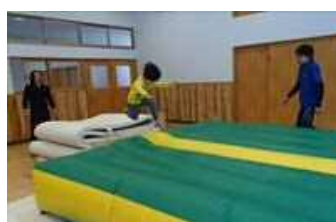
エアポリン (感覚・運動)