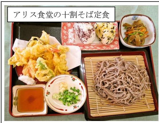
アリス食堂の十割そば定食