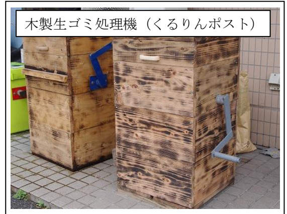
木製生ゴミ処理機 (くるりんポスト)