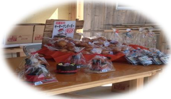
イベントでの販売