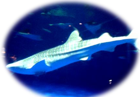
鹿児島水族館 ジンベイサメ