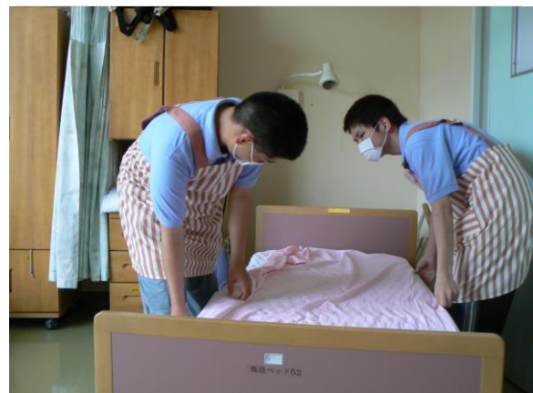
ベッドメイキング作業