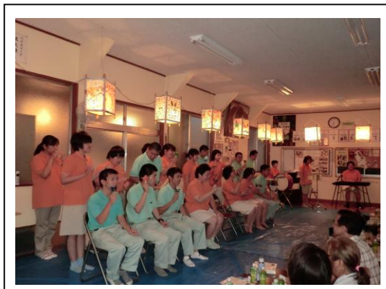
納涼大会・音楽活動