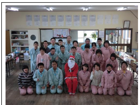
クリスマス・誕生会