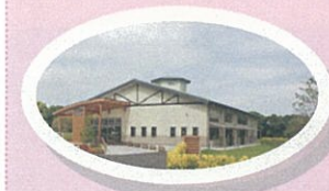
こども発達支援センター めぶき園